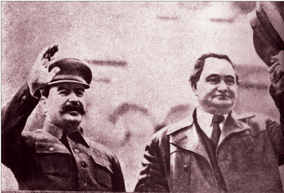
J. Stalin y J. Dimitrov, dirigentes de la Internacional Comunista

El Congreso adoptó medidas contra el peligro de guerras imperialistas. «La causa de la guerra como fenómeno histórico —se señala en las tesis al respecto— no radica en el ‘el principio malo connatural’ del hombre ni en la política ‘mala’ de los gobiernos, sino en la división de las sociedad en clases, en explotadores y explotados. El capitalismo es la causa de las guerras en la historia contemporánea». Jorge Dimitrov (dirigente comunista búlgaro que a partir de 1934 dirigió la IC) precisó que «si bien las guerras entre las potencias capitalistas son muy posibles